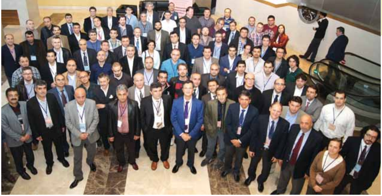
21-24 Kasım 2013, İzmir Swisotel Grand Efes'de "Dr.Mehmet Z-ileli İleri- Spi-nal Cerrahi- Kursu - 13.Kurs" düzenlendi. 34 konuşmacının görev aldığı toplantıya 116 kursiyer katıldı.