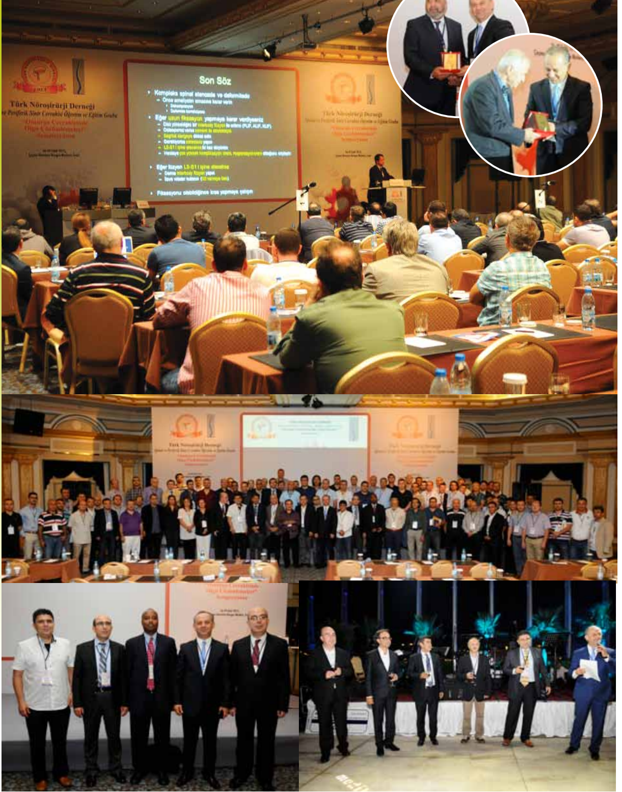
26 – 29 Eylül 2013, İzmir Çeşme Sheraton Kongre Merkezinde, “Olgu Çözümlenmeleri” Sempozyumu düzenlendi. 1’i yurtdışı 65 konuşmacının görev aldığı sempozyumda 358 katılımcı mevcuttu.