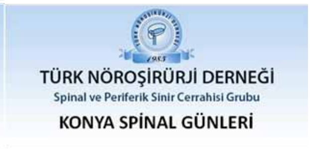
Grubumuz kapsamında İstanbul, Ankara, İzmir ve Konya'da "Aylık Spinal Toplantılar" düzenlenmektedir.