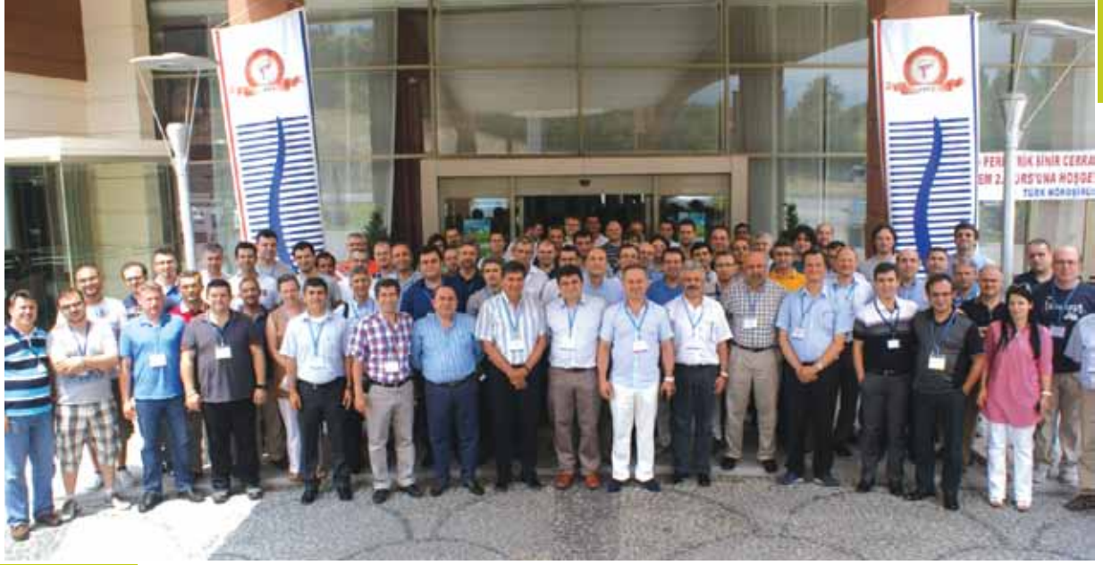
27 -30 Haziran 2013, Manisa Anemon otelde, Yaz okulu 4.dönem II kurs 75 kursiyer, 35 eğitmen, 44 konu anlatımı, 32 olgu tartışması ile maket üzerinde spinal enstrümantasyon uygulama kursu yapıldı.