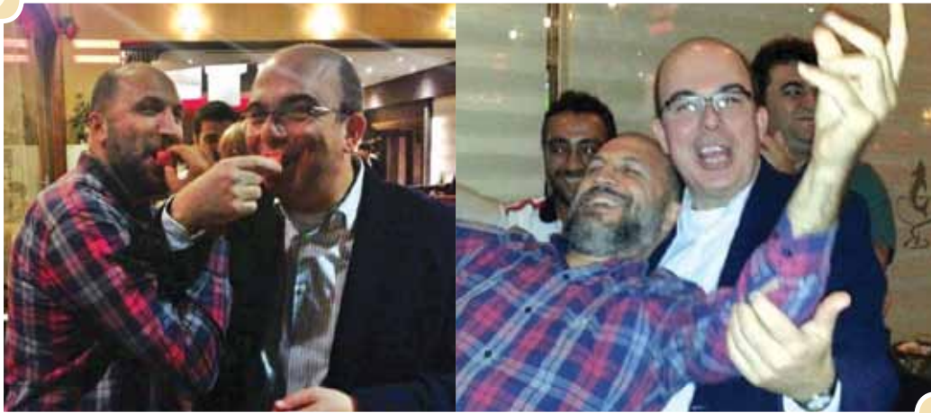
Son 2 Başkan adayımız