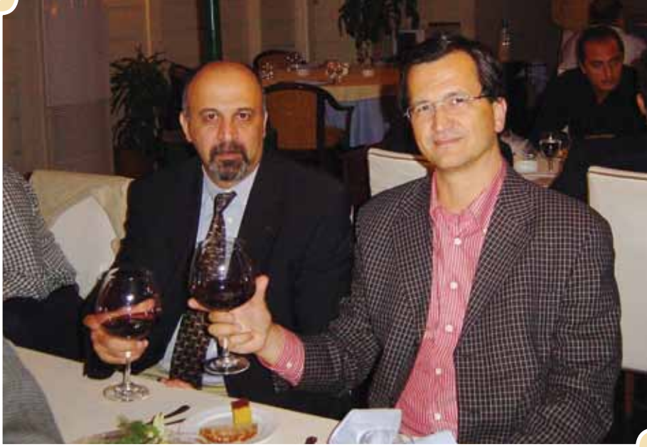
İlk 2 Başkanımız