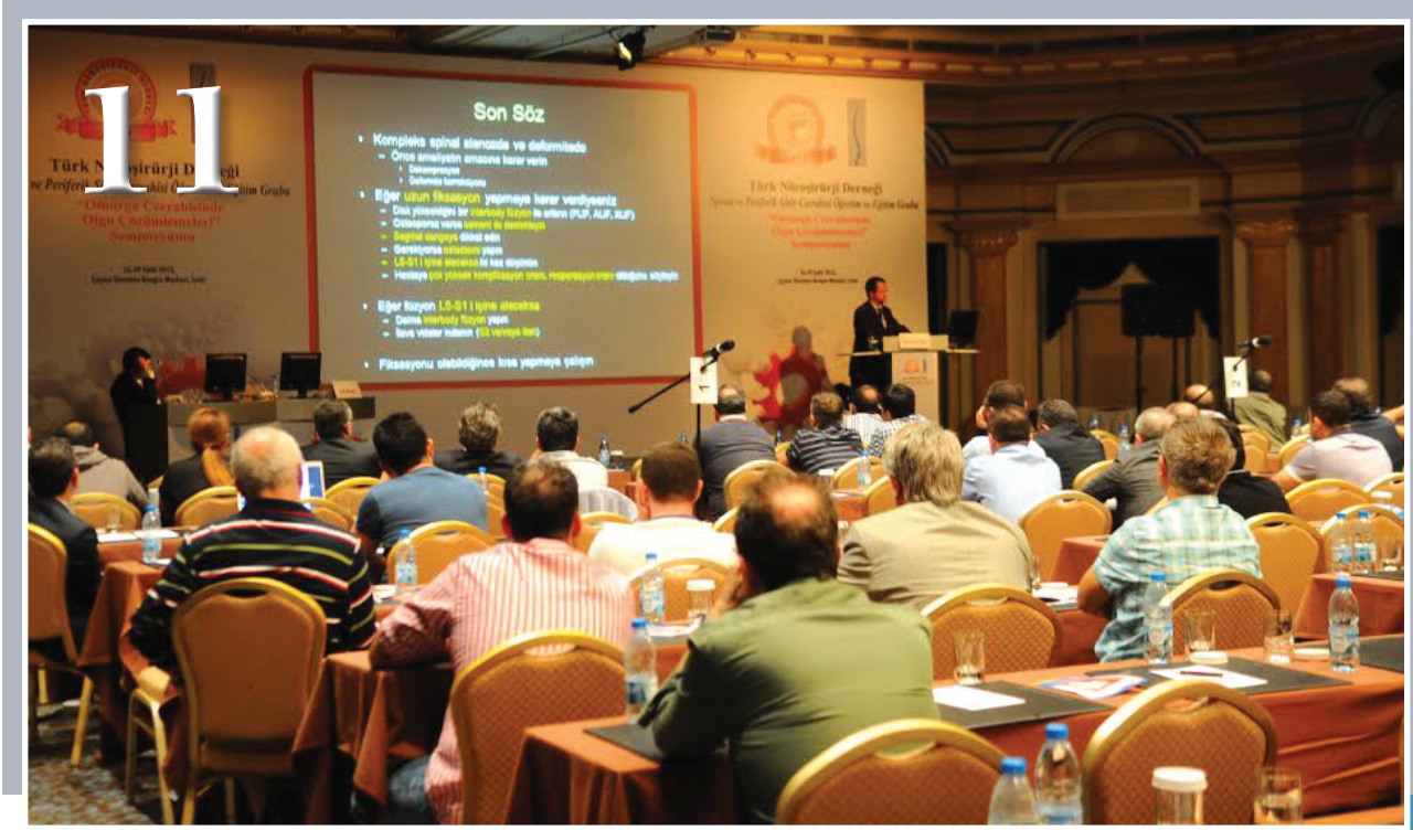
26-29 Eylül 2013, İzmir Çeşme Sheraton Kongre Merkezinde, “Olgu Çözümlenmeleri” Sempozyumu” düzenlendi. 1’i yurtdışı 65 konuşmacının görev aldığı sempozyumda 358 katılımcı mevcuttu.