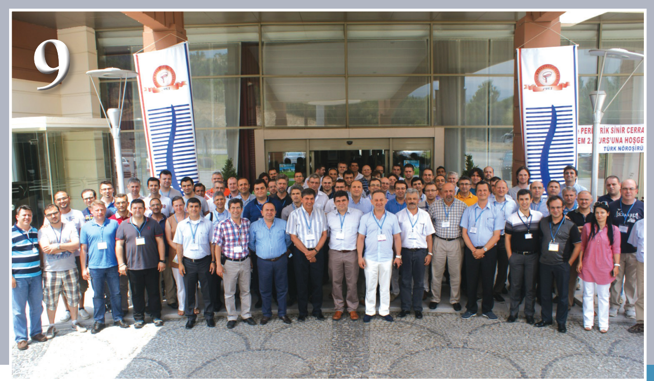
27-30 Haziran 2013, Manisa Anemon otelde, Yaz okulu 4.dönem II kurs 75 kursiyer, 35 eğitmen, 44 konu anlatımı, 32 olgu tartışması ile maket üzerinde spinal enstrümantasyon uygulama kursu yapıldı.