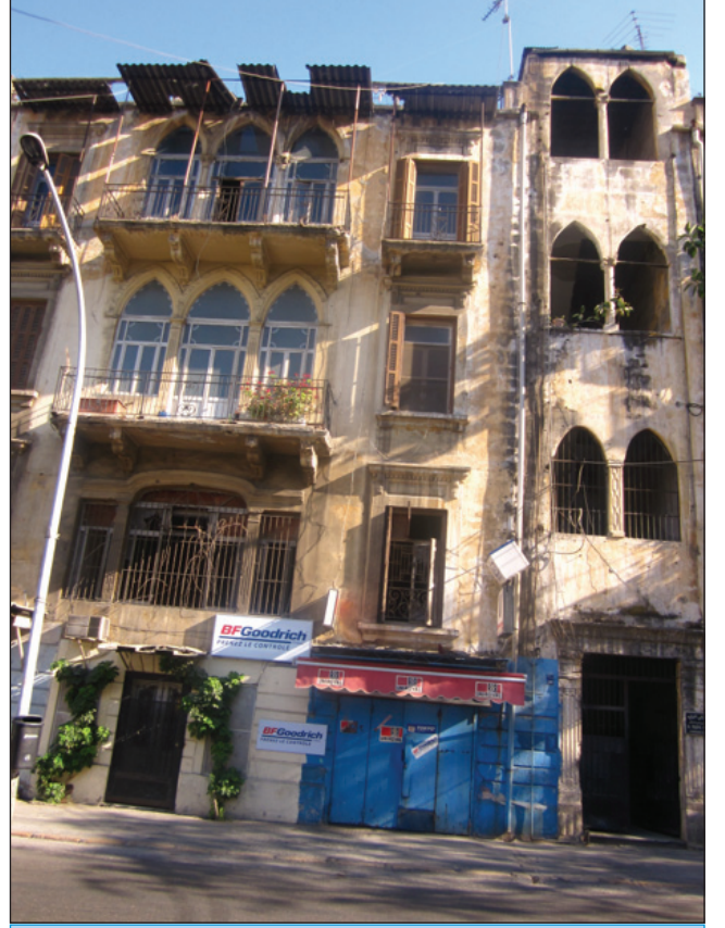
Beyrut sokaklarından eski binalar

ziyaretçilerine görecek bir çok mekan sunuyor. Tarihe ve akdeniz şehirlerine ilgi duyan meslektaşlarıma, gelecek S.P.I.N.E toplantılarına katılarak Beyrutta hem mesleki hem turistik bir gezi yapmalarını öneririm.