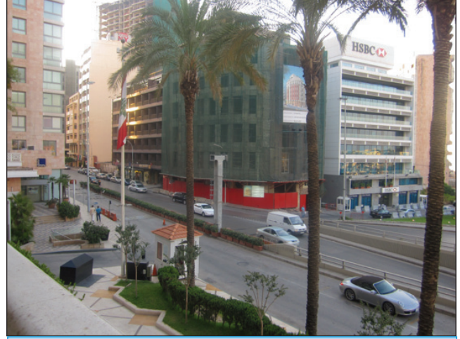
Kongre oteli Phonecia'dan bir Beyrut caddesi manzarası

Lübnan ve Beyrut. Zengin bir tarihe sahip olan Lübnan, geçirdiği yıkıcı iç savaşın etkilerini büyük ölçüde atlatmakla beraber, bölgedeki güvenlik ve stabilite sorunlarını hala yaşamaya devam ediyor. 1990'larda sona eren içsavaştan önce Müslüman ve Hristiyan nüfus eşitken, bugün göçlerin etkisiyle Hristiyan nüfusu %35'lere inmiş. Batıların güzel ve çok eski bir akdeniz şehri olan zengin Beyrut'a geleneksel ilgisi devam ediyor ve Beyruta büyük bir yatırım var. Eski ve modern, yıkımın izleri ve kalkınma bir arada. Beyrut sokakları canlı ve kozmopolit. İstanbul'dan 1 saat 45 dakikada Beyruta uçuluyor. Fiyatlar ülkemizle hemen hemen aynı. Beyrut