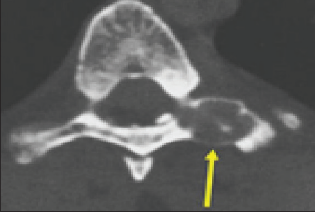
Şekil 2: Vertebra posterior elemanlarında ekspansil, destrüktif, kısmen kalsifiye lezyonun aksiyel bilgisayarlı tomografi incelemesi.

de yüksek sinyal yoğunlukları olarak ortaya çıkabilir. Kemik sintigrafisi, osteblastomalar için en hassas radyografik incelemedir (3). Nadiren, osteblastoma, serum fosfat seviyesinin düşük, kalsiyum normal ve alkalın fosfatazın yükseldiği onkogenik osteomalaziye neden olabilir.